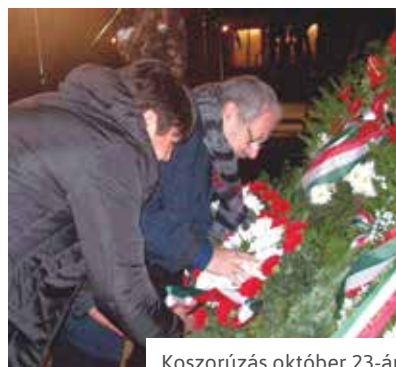
Koszorúzás október 23-án

kerületünk a 4. legeladósodottabb volt Budapesten az egy főre eső 100 000 forint feletti adósságállománnyal. Még szerencse, hogy már 2008-