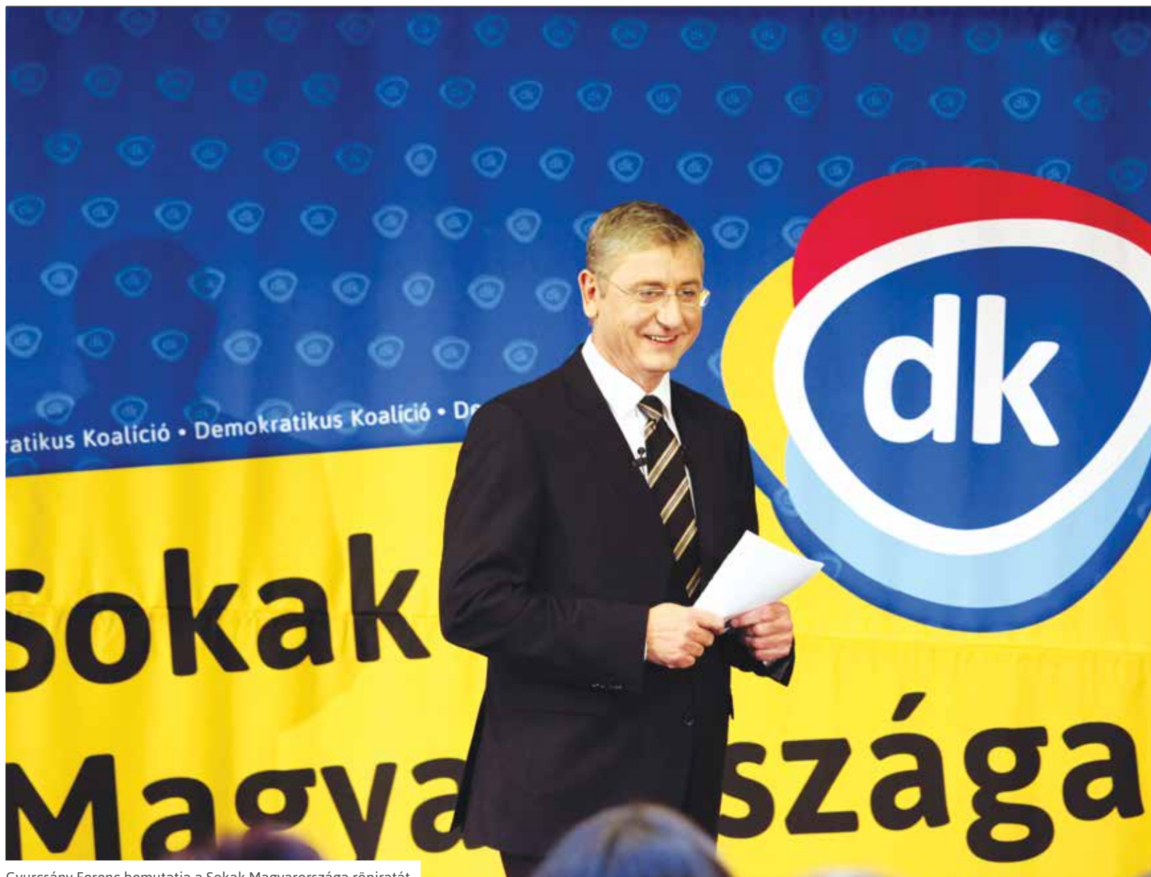
Gyurcsány Ferenc bemutatja a Sokak Magyarországa röpiratát