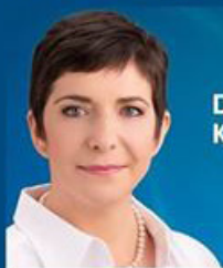
Dr. Dobrev Klára

Köszönjük szépen a legeurópaibb pártra leadott szavazatokat!