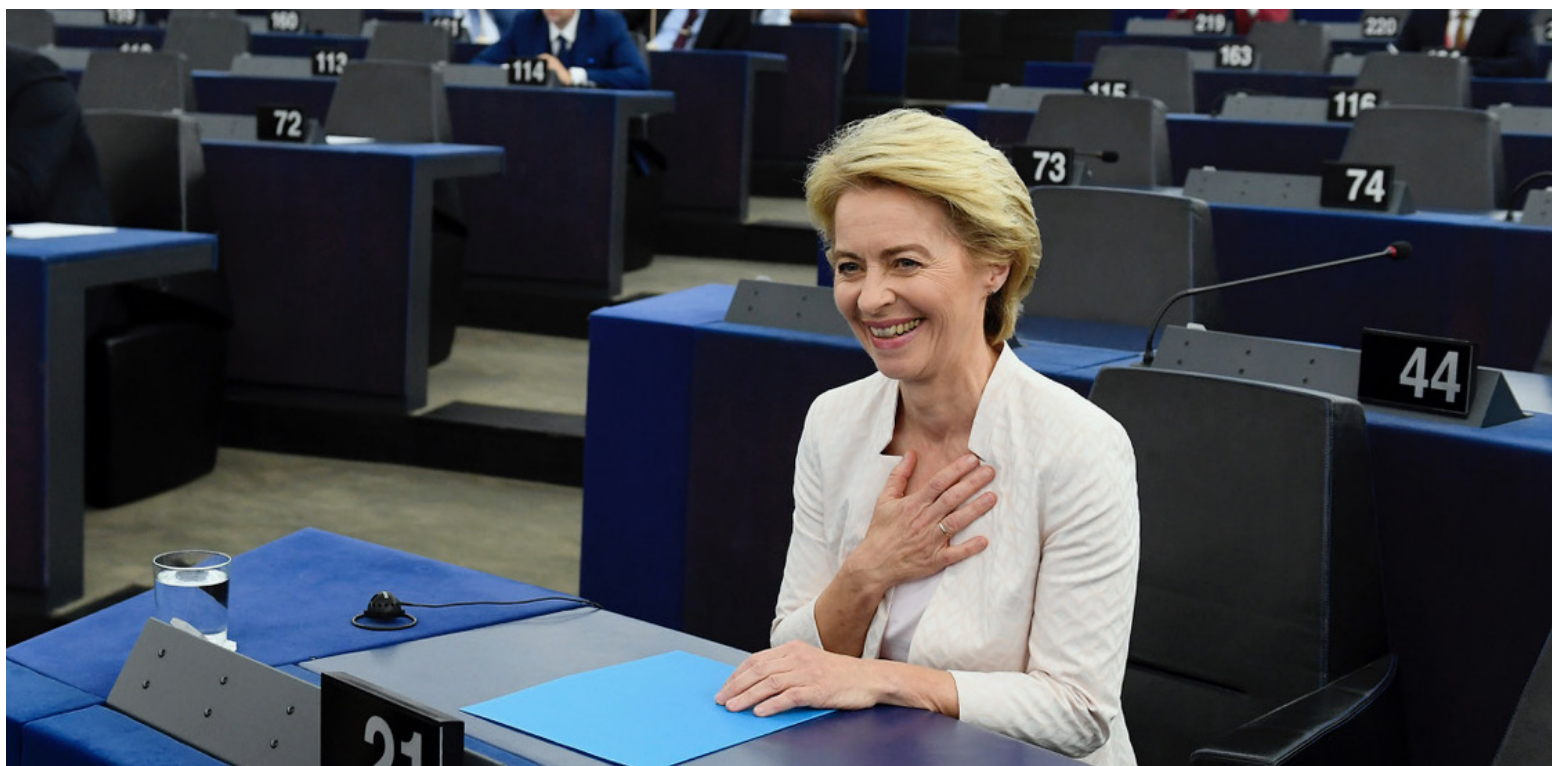
Ursula von der Leyen, az Európai Bizottság frissen megválasztott elnöke, aki az október 31-én leköszönő Juncker helyét veszi át

Bár Orbán Viktor továbbra is itthoni eredményeivel kérkedik, Európában egyre fogy körülötte a levegő: a bizottság új elnöke kifejezetten az Európai Egyesült Államok híve, és határozott fellépést ígért a jogállamiságot megsértő tagállamokkal szemben. Ráadásul a fideszes jelöltek megválasztását sikerrel blokkolta az Európai Parlament szociáldemokrata, zöld és liberális frakciója.