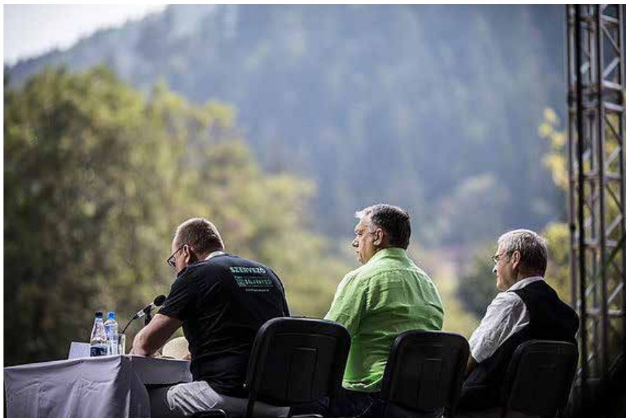
Orbán Tuszványoson: Háttal a valóságnak

ségéhez tud vagy kíván szólni, a Néppárt egésze számára azonban üzenetei nem elfogadhatók, mi több, egyre több jel utal arra, hogy tolerálhatóknak sem mondhatók.