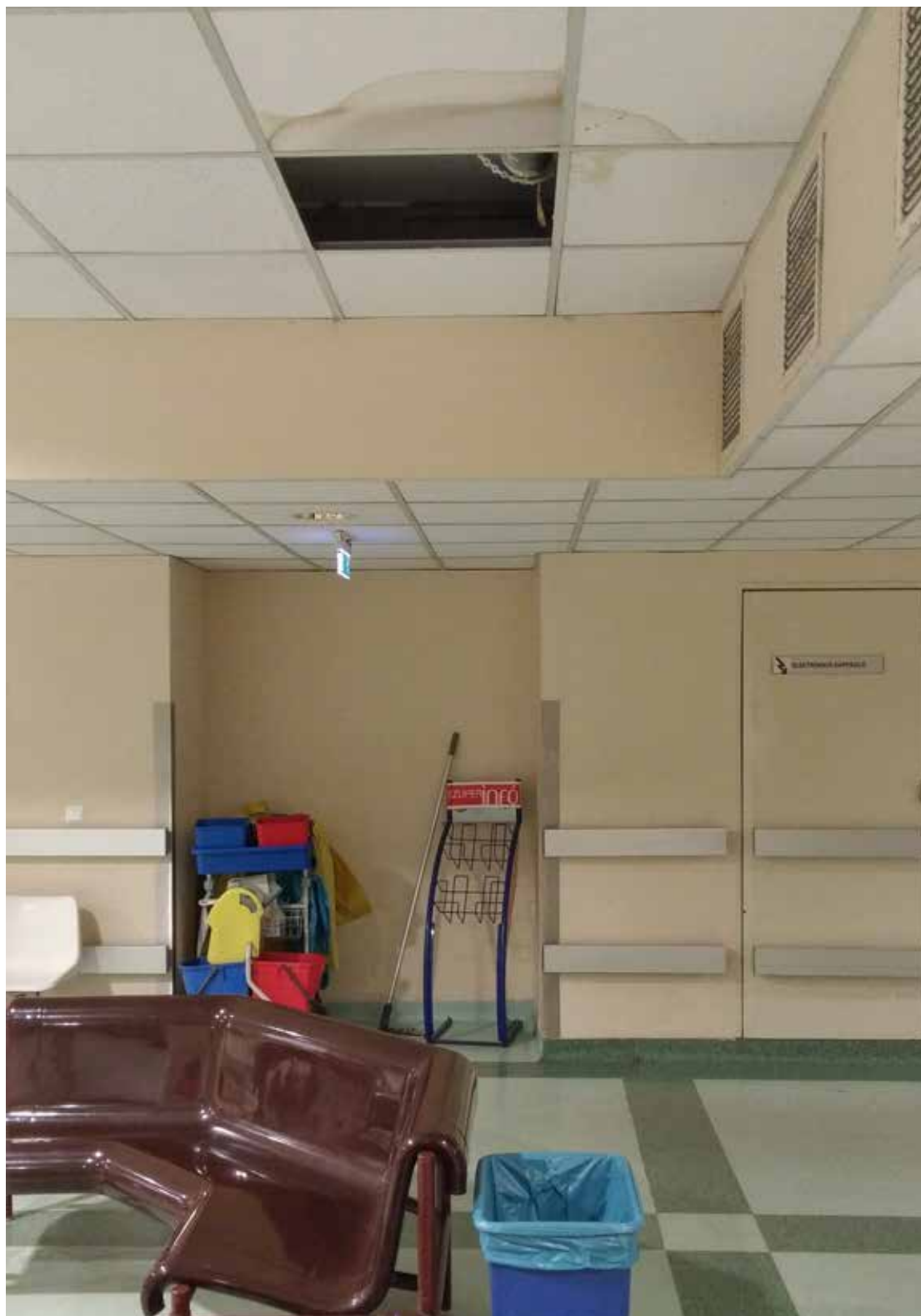
Ránk szakad az egészségügy, meg a kórházi plafon

– Egy kormány nem teheti meg, hogy a megélhetési minimumot a minimálbér alatt állapítja meg – mondta az elnök.