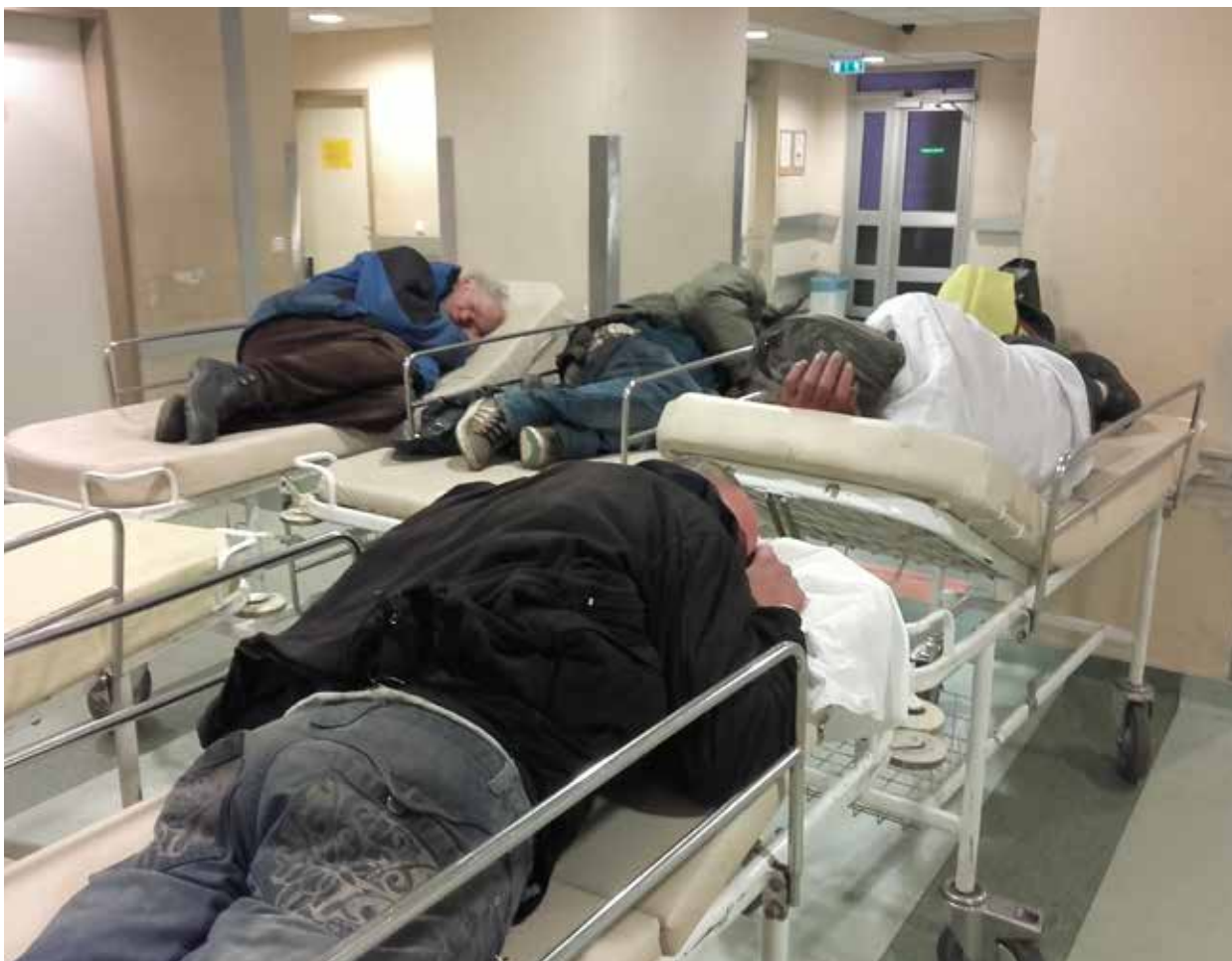
Döbbenetes állapotok a kórházakban, ilyen körülmények között se dolgozni, se gyógyulni nemigen lehet

Van, aki azt mondja, hogy a magyar egészségügy már összeomlott, van, aki szerint a betegek lassan már nem gyógyulni, hanem meghalni járnak a kórházakba. Az orvosok és a nővérek egyre gyorsuló ütemben áramlanak Nyugat-Európába, az orvos- és még inkább a nővérhány miatt egyes kórházak működése is veszélybe kerülhet. A jó hangosan beharangozott budapesti „szuperkórház” építése eközben csendesen elhalt, így marad minden a régiben: zsúfolt, leharcolt, régi rendelők, mellettük új, drága és üres stadionok.