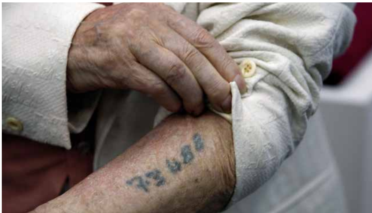
Nem felejtethetjük el, hova vezetett az a korszak, amikor nem volt politikai korrektség

Ide jutottunk, miközben a Fidesz a politikai korrektséget leváltotta a karaktergyilkosságra, legitímálva bármit, amit a demokratikus világ tabunak tekint. Így néz ki, amikor egy kormány ráront a saját nemzetére.