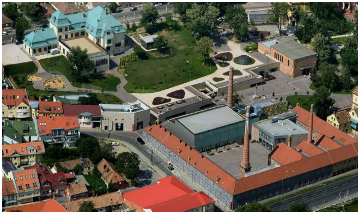
A pécsi Zsolnay negyed – egy a Gyurcsány- és Bajnai-kormányok számos fejlesztése közül

2014–2020 között Magyarországnak a továbbra is lehetősége van arra, hogy az unió pénzügyi, fejlesztési forrásait igénybe vegye és azt a magyar családok életének biztonságosabbá tételéhez felhasználja. Biztonságot a családban, a lakhatásban, a munkahelyeken, lehetőséget a tanulásban és a gyógyulásban. Egy család Várba költözése nem érhet fel 200 ezer család otthonának energiatakarékos korszerűsítésével.