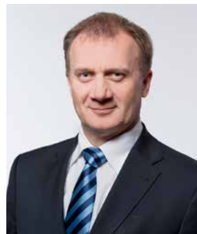
Varju László alelnök, DK a Nemzeti Gazdasági Minisztérium volt államtitkára

A fejlődést ugyan megakasztotta a világgazdasági válság, de épp az európai uniós források segítettek a munkahelyek jelentős részének megőrzésében. Erre az alapra támaszkodva maradt életben az építőipar és jutott forráshoz sok vállalkozás. 2010-től folytatható volt a kivitelezés politikai erőszak nélkül is, nagyobb része a Széchenyi Terv keretében az Orbán-kormány elmúlt 6 éve alatt. De a lendület megakadt, s egy éven át teljes volt a bizonytalanság. A pártpolitika rátele-